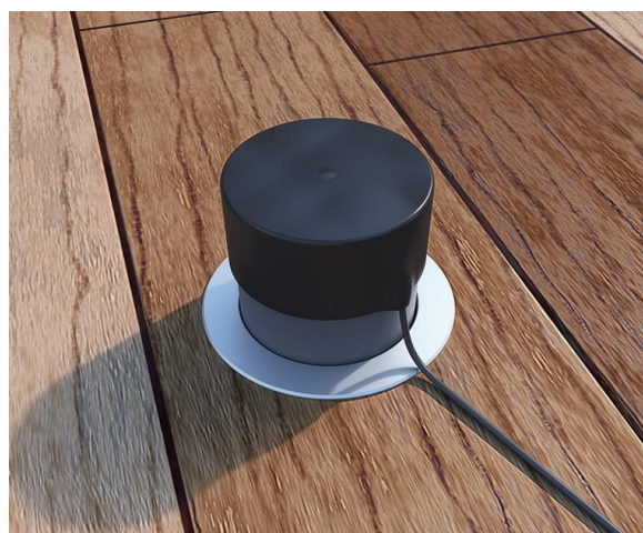
Nástavec se zásuvkou STAKOHOME-7501-A