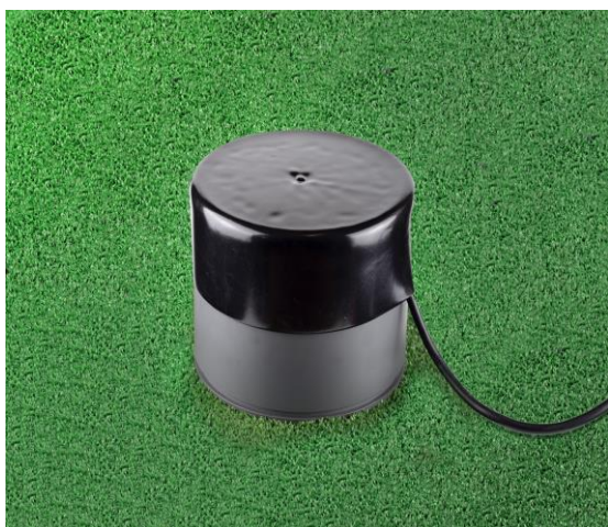
Nástavec se zásuvkou

Obr. Zabudovaná podlahová zásuvka, včetně použití nástavce PVC + ochranného černého krytu.