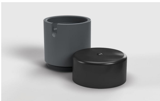
Obr. Nástavec PVC + horní ochranný kryt

Poté se připojí požadované zařízení, kabely se protáhnou otvory v nástavci a víko se přišroubuje na nástavec. Na nástavec se přetáhne černý gumový kryt. Připojené kabely (od spotřebičů/zařízení) prochází otvory v nástavci PVC a pod černým ochranným krytem dolů. Víko (které není v nástavci šroubovací) je možné nechat v nástavci, aby byla zpevněná horní plocha.